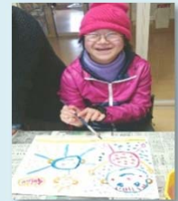
第2ふれあい工房を拠点に、休日クラブを偶数月に1回開催