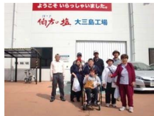
余暇支援(大三島への旅行)