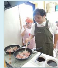
第2ふれあい工房にて、料理教室を奇数月に1回開催