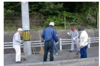
地域での清掃活動